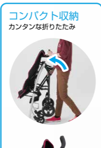
コンパクト収納 カンタンに折りたたみ