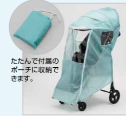
たたんで付属のポーチに収納できます。

マルチレインカバー「ほげった」 税込価格 16,940円 (本体価格 15,400円) 少雨による搭乗者と本体の濡れを防ぐ薄く軽量のレインカバー。ファスナー開閉式。 ※「ほげった」の使用には「日除け」もしくは「サマーシールドPB日除け」の取り付けが必要です。 ※激しい雨や強風を防ぐことはできません。