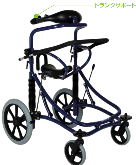
トランクサポート