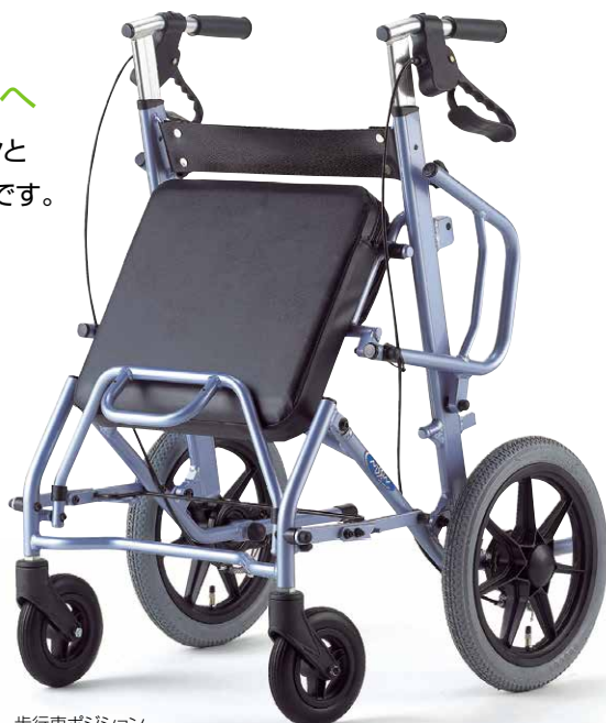
歩行車ポジション