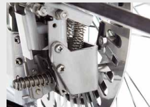
乗車者が立ち上がった瞬間、自動で安全ブレーキが安全を確保!