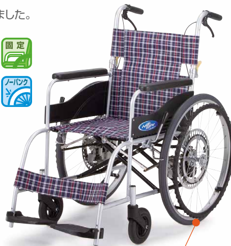
ノーバンク(ハイポリマー)タイヤ