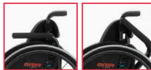
▲固定式 ▲跳ね上げ式

固定式と跳ね上げ式の2種類より選択。 アームサポート高は28～32cmの間 で指定できます。 ※アームサポートなしの設定も選択可能です。