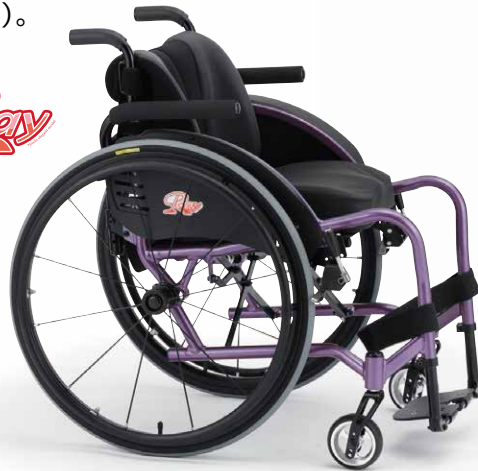
PHOTO/Ray(レイ) フレームカラー：プリティパープル バックサポートカラー：CORE8U 座クッション(オプション) 【参考重量】11.8kg(座クッション含まず)