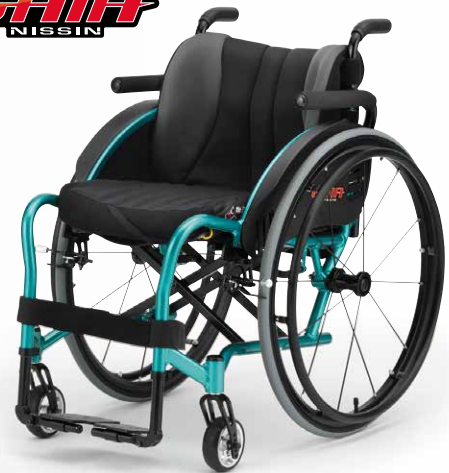
PHOTO/GAIA(ガイア) フレームカラー：ブルーグリーン バックサポートカラー：CORE8U 座クッション(オプション) 【参考重量】11.7kg(座クッション含まず)